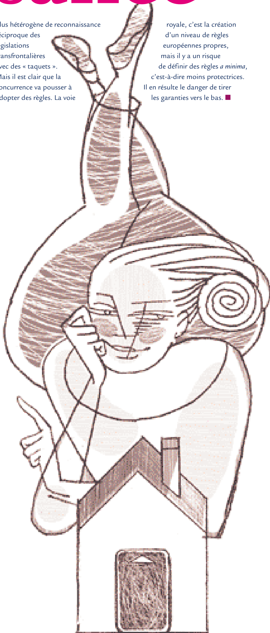
Illustration : Jean-Louis Floch

royale, c'est la création d'un niveau de règles européennes propres, mais il y a un risque de définir des règles a minima , c'est-à-dire moins protectrices. Il en résulte le danger de tirer les garanties vers le bas. ■