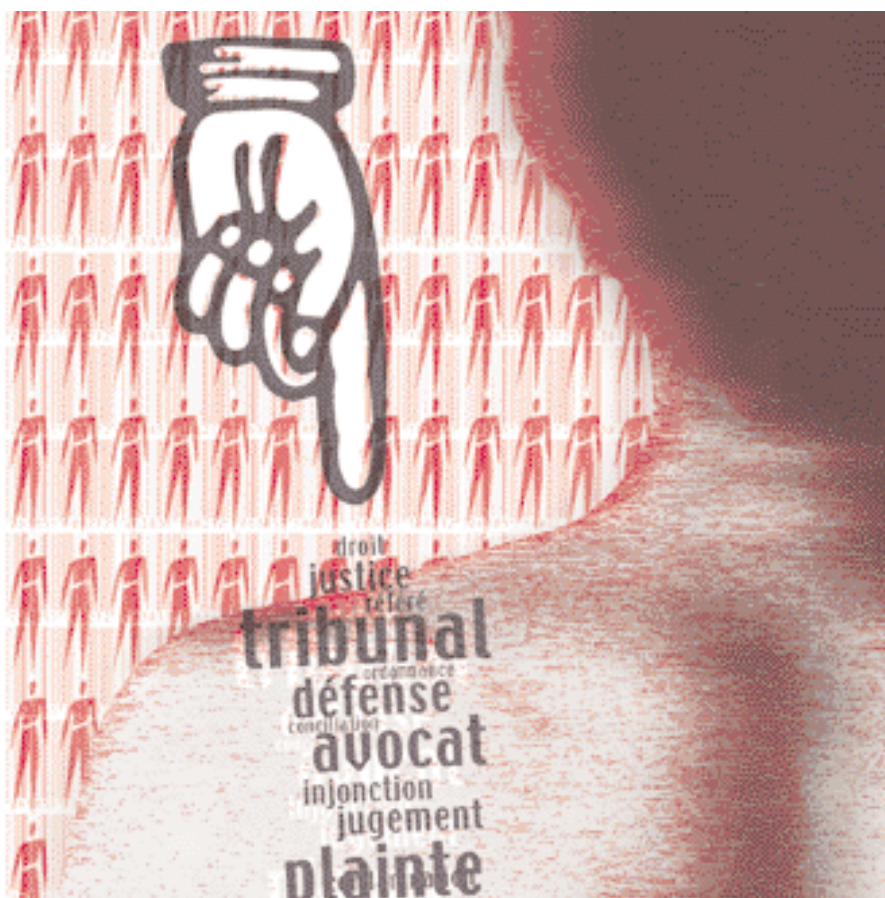
Illustration : Eric Cichacki

« La démocratie ne procède pas du seul principe de la représentation par l'élection mais de conflits de pouvoirs, de droits, de légitimité. C'est le conflit qui est l'essence du jeu démocratique et qui garantit sa